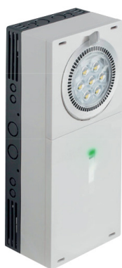
01 ALTILED ET 1000L A