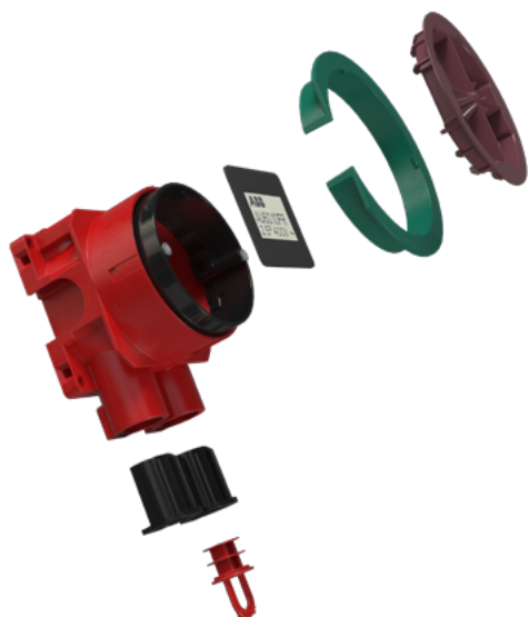
01 Apparatdosa AU60.10FR

Apparatdosan har två fasta stutsar för 16/20mm rör. Varav en har en borttagbar dosutloppstätning. Dosan har 4 ytterligare "knock-outs" i sidorna och två i botten. Montageringens fästskruvar har cc 60mm. Tillverkad i halogenfritt material enligt IEC/ EN60670 standard: 2005 (Glödtrådtext 850 °C).