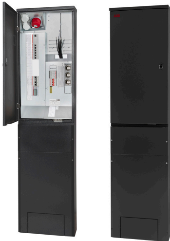
01 Näpsä SMART -EV ulkomittauskeskus 1T-MK50J-O-EVC-B, tumma

Kokonaisratkaisu sähköauton lataukseen tai järkevä varautuminen tulevaisuuteen – Näpsä SMART -EV-ulkomittauskeskus ja Terra AC-latausasema tuovat kiinteistösi 2020-luvulle. Nyt valikoimaan on lisätty myös tumma ulkomittauskeskus tyylikkääseen asennukseen tumman rakennuksen seinään.