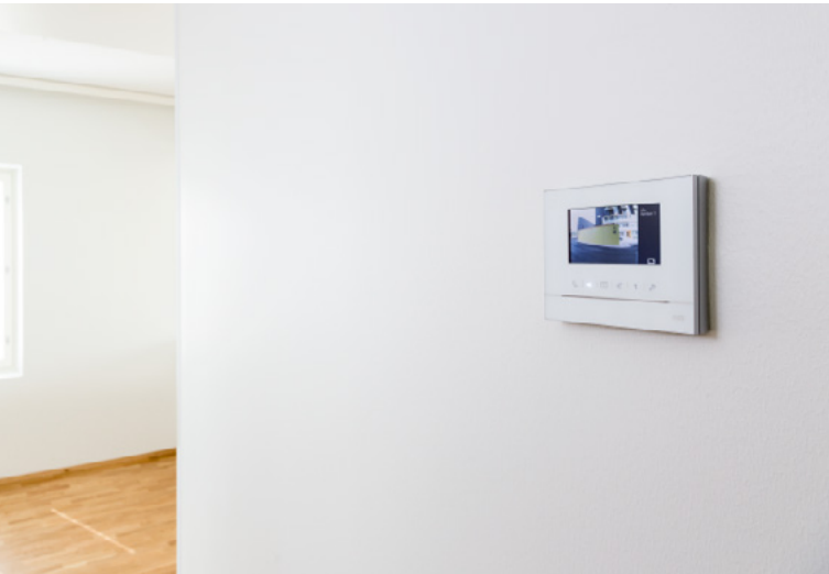
ABB-Welcome Korokepalat pinta-asennukseen

Saneerauksessa ovipuhelimen väyläkaapeli joudutaan usein asentamaan pinta-asennuksena. Sisäyksikkö voidaan kätevästi kohottaa neljällä korokepalalla hieman irti seinästä.