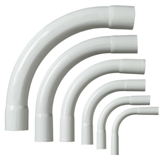
01 Halogenfria rörböjar