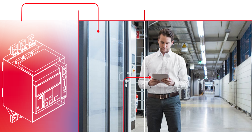
ABB Electrification Service France