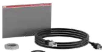
Befestigungsset für HMI