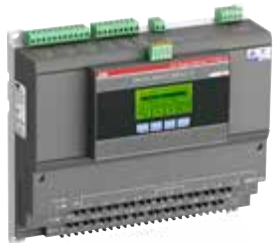
Lichtbogenwächter mit COM-Modul