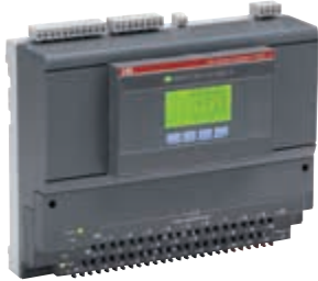
Lichtbogenwächter mit HMI-Modul