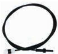
Lichtwellenleiter mit Detektor