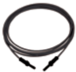
Optisches Kabel TVOC-2 – TVOC-2