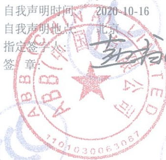
ABB Oy Smart Power PO.Box 622 FI-65101 VAASA FINLAND

注: 有关本声明信息真伪可登录全国认证认可信息公共服务平台 (cx.cnca.cn) 或扫描右上角二维码查询。