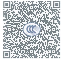
ABB Oy (生产者) 及 ABB (中国) 有限公司(生产者授权代表) 确知知晓《强制性产品认证自我声明实施规则》以及相关产品强制性认证实施规则的要求, 对本声明承担全部法律责任。

ABB Oy (生产者) 及 ABB (中国) 有限公司(生产者授权代表) 声明以下产品已按照《强制性产品认证自我声明实施规则》以及相关产品强制性认证实施规则的要求进行检测, 符合相关标准要求; 自本声明签署之日起, 生产和销售的产品持续符合以下标准与实施规则的要求; 保存本声明涉及的技术文档至少10年; 正确使用强制性产品认证标志; 如产品或其符合性信息发生变更, 将及时更新技术文档并报送产品变更信息。