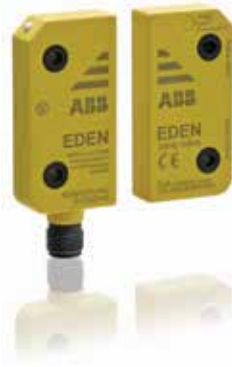
Berührungsloser Sicherheitssensor Eden OSSD