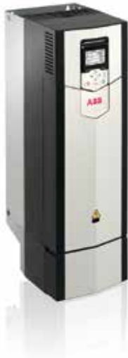
ACS880-01 R5 Frequenzumrichter