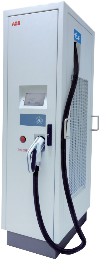
*图片仅供参考，请以实物为准