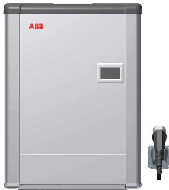
*图片仅供参考，请以实物为准

在接入互联网的情况下，壁挂式直流充电机还可以通过用户自己设计开发的智能手机应用进行控制，并可以完成远程升级和服务。