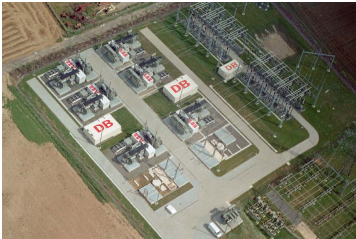
ABB 15-MW-Standardumrichter – 8 Units 3AC 20 kV 50 Hz – 2AC 110 kV 16,7 Hz 151,2 MVA / 120 MW