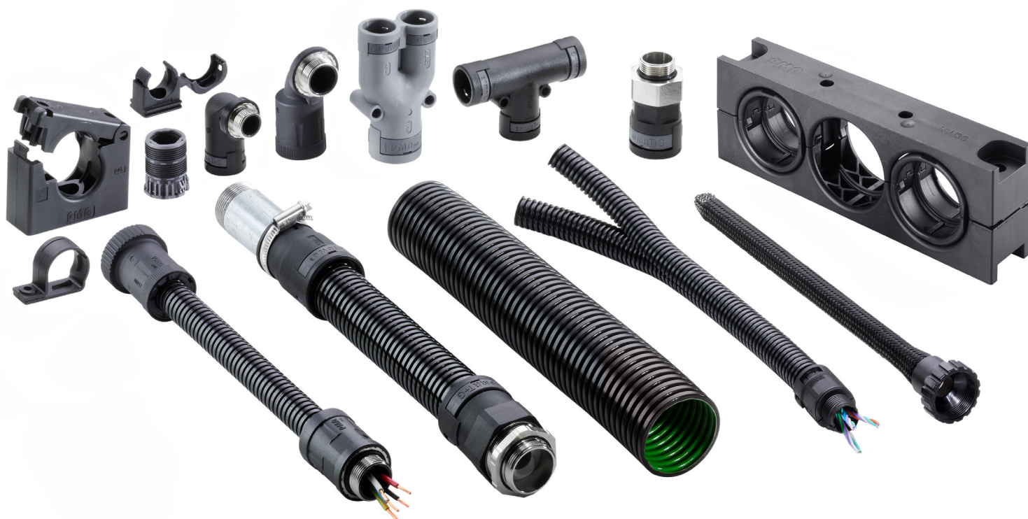
ABB bietet mit dem PMA-Kabelschutzsortiment ein umfassendes Portfolio von Wellrohren, Verschraubungen und Zubehör für die unterschiedlichsten Märkte und Anwendungen.