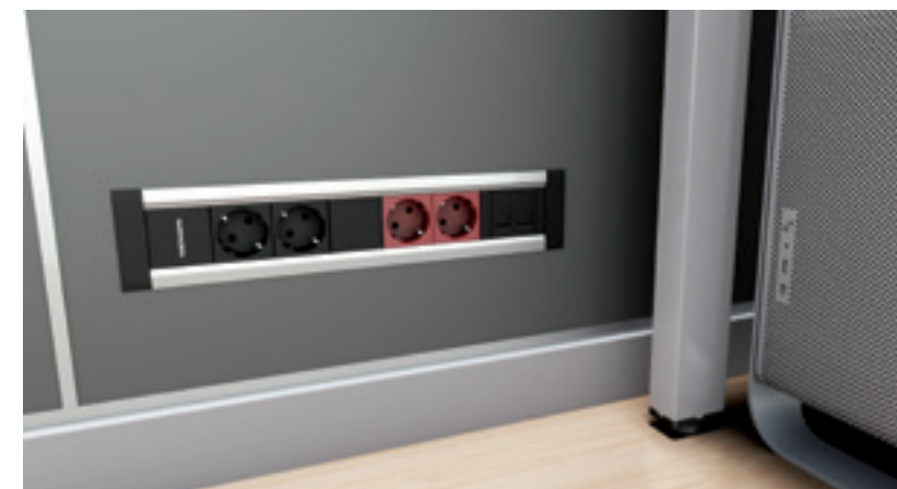
Kit conexión empotrado en partición

Un espacio ordenado, y operativo para que contribuya a hacer que las horas de trabajo sean mucho más agradables.