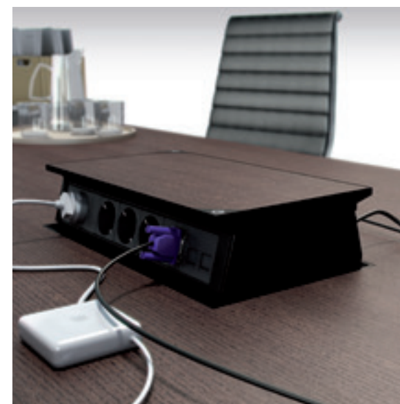
Puesto motorizado de dos caras abierto

Esto facilita enormemente el trabajo de conexión o intercambio de los mecanismos, ya que no obliga a trabajar dentro de la caja, sino cómodamente fuera de ella.