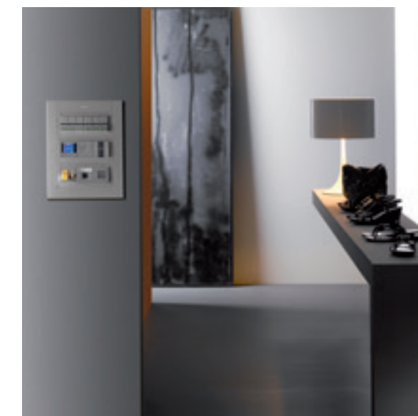
Puesto de trabajo de superficie