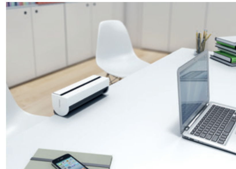
Conexión de superficie con tapa abatible

Con nuestros sistemas de conectividad eléctrica y multimedia podrás ocultar y ordenar los cables de manera que los espacios quedan liberados de los mismos.