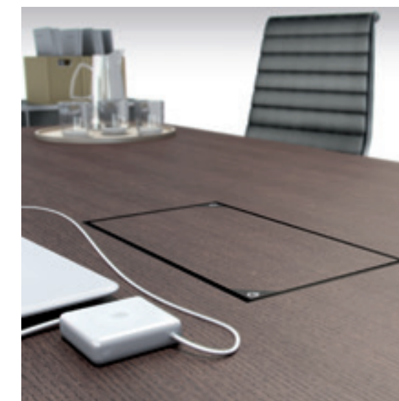
Puesto motorizado de dos caras cerrado