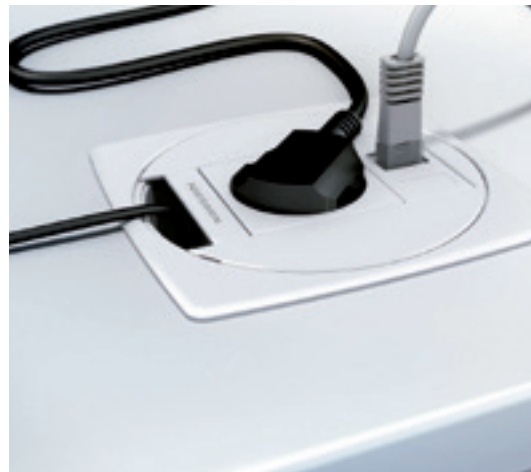
Punto de conexión blanco con toma eléctrica, RJ45 y pasa cables