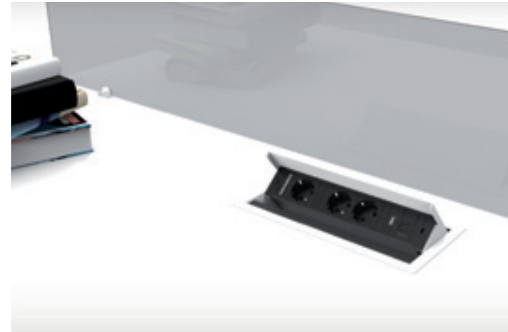
Caja con conexión abatible de 4 módulos