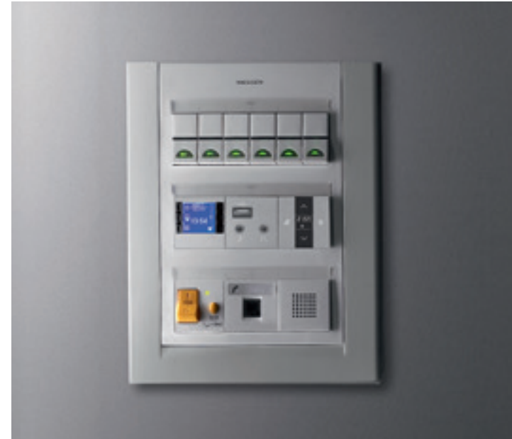
Centralización de mando Zenit empotrada

Y lo más importante, todos nuestros productos están avalados por nuestra forma de hacer las cosas y por nuestra garantía en diseño, calidad y funcionalidad.