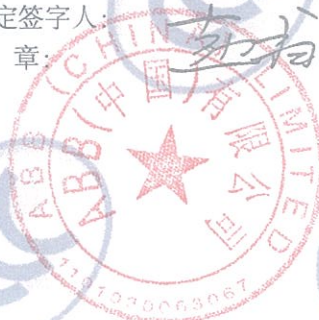
ABB Oy Smart Power P.O.Box 622 FI-65101 VAASA FINLAND

注: 有关本声明信息真伪可登录全国认证认可信息公共服务平台 (cx.cnca.cn) 或扫描右上角二维码查询。