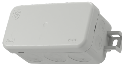
ABB hjälper kunderna att göra miljövänliga val. Miljövarudeklarationer av typ III (EPD:er) publiceras för AP45-dosor för full insyn i miljöpåverkan under hela produktens livscykel. AP45-dosor tillverkas i Finland med korta logistikkedjor. Produktförpackningen innehåller upp till 90 % återvunnet material och användningen av plast är minimerad.

Dessutom är AP45-kopplingsdosor certifierade med ABB:s EcoSolutions™-etikett, vilket garanterar att produkten är konstruerad och tillverkad enligt stränga cirkularitetsriktlinjer som fastställts av ABB. Vårt eget miljömärke hjälper oss i vår resa mot mer hållbara produkter.