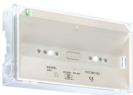
01 Brio+ 60L A / DL