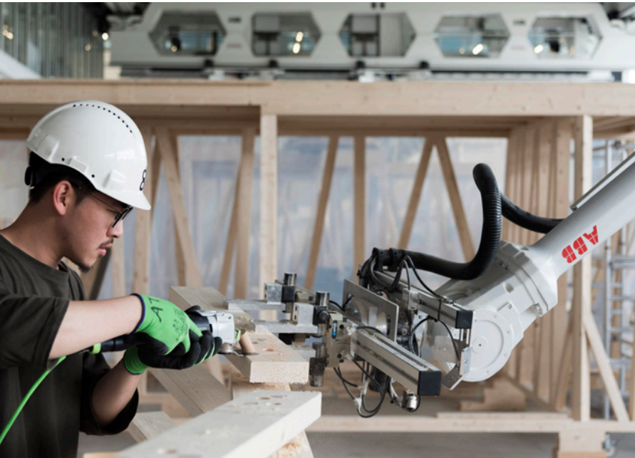
Gramazio Kohler Research, ETH Zürich

— Gebäudemodule aus Holz werden am Robotic Fabrication Laboratory der ETH mithilfe von zwei mit PMA-Kabelschutzprodukten ausgerüsteten ABB-Robotern vorfabriziert.