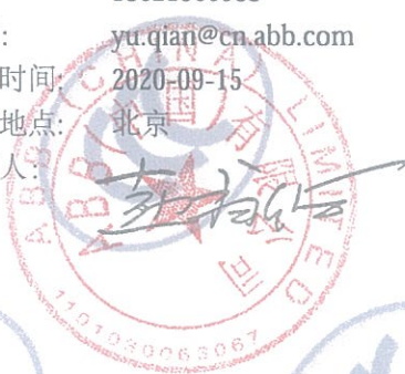
ABB Oy Smart Power P.O.Box 622 FI-65101 VAASA FINLAND

注: 有关本声明信息真伪可登录全国认证认可信息公共服务平台 (cx.cnca.cn) 或扫描右上角二维码查询。