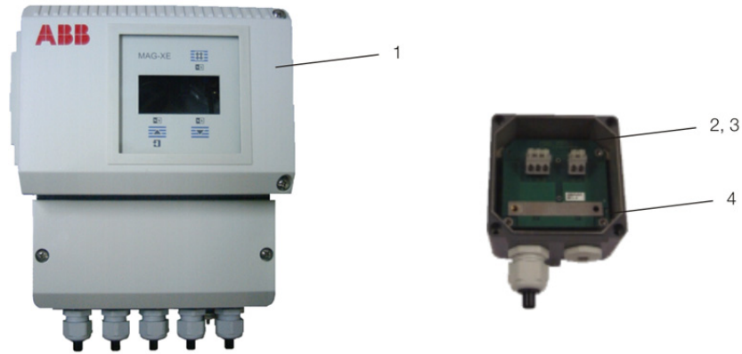
Abb. 2: MAG XE4