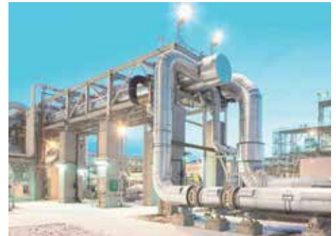
Petróleo y gas