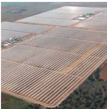
ABB suministra productos y soluciones de distribución de baja, media y alta tensión, transformadores de potencia y distribución, variadores de velocidad, unidades de alimentación ininterrumpidas, centros de control de motores, así como automatización de subestaciones y SCADA eléctricos para toda la planta.

La planta está siendo construida por TSGI y la participación de ABB en el proyecto empezó como consultor asesorando en el diseño de sistemas eléctricos; continuó como proveedor de más de 100 millones de dólares en productos y servicios relacionados con el paquete de electrificación de la refinería.