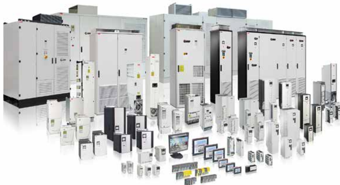
Gama de variadores de baja y media tensión, con intervalo de potencia desde 0,18 kW hasta más de 100 MW. Plataforma de PLC AC500 y HMI.

ABB proporciona una plataforma común de variadores de velocidad de baja y media tensión: variadores de distintas familias, con la misma interfaz, con un funcionamiento similar, las mismas herramientas y la misma conectividad. Trabajando distintas tensiones con la misma simplicidad de uso en todo el rango de potencia.