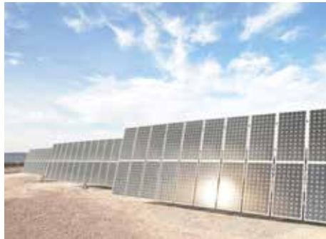
Generación de energía