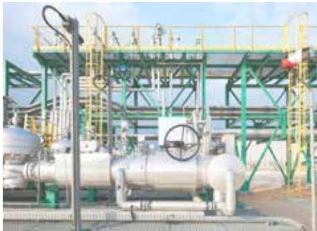
Aguas limpias y residuales