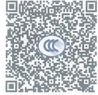
ABB Oy (生产者) 及 ABB (中国) 有限公司(生产者授权代表) 确认知晓《强制性产品认证自我声明实施规则》以及相关产品强制性认证实施规则的要求, 对本声明承担全部法律责任。

ABB Oy (生产者) 及 ABB (中国) 有限公司(生产者授权代表) 声明以下产品已按照《强制性产品认证自我声明实施规则》以及相关产品强制性认证实施规则的要求进行检测, 符合相关标准要求; 自本声明签署之日起, 生产和销售的产品持续符合以下标准与实施规则的要求; 保存本声明涉及的技术文档至少10年; 正确使用强制性产品认证标志; 如产品或其符合性信息发生变更, 将及时更新技术文档并报送产品变更信息。