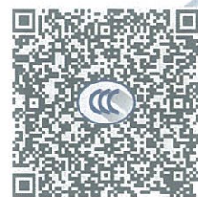
ABB Oy (生产者) 及 ABB (中国) 有限公司(生产者授权代表) 确认知晓《强制性产品认证自我声明实施规则》以及相关产品强制性认证实施规则的要求, 对本声明承担全部法律责任。

ABB Oy (生产者) 及 ABB (中国) 有限公司(生产者授权代表) 声明以下产品已按照《强制性产品认证自我声明实施规则》以及相关产品强制性认证实施规则的要求进行检测, 符合相关标准要求; 自本声明签署之日起, 生产和销售的产品持续符合以下标准与实施规则的要求; 保存本声明涉及的技术文档至少10年; 正确使用强制性产品认证标志; 如产品或其符合性信息发生变更, 将及时更新技术文档并报送产品变更信息。