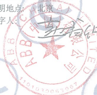
ABB Oy Smart Power P.O.Box 622 FI-65101 VAASA FINLAND

注: 有关本声明信息真伪可登录全国认证认可信息公共服务平台 (cx.cnca.cn) 或扫描右上角二维码查询。