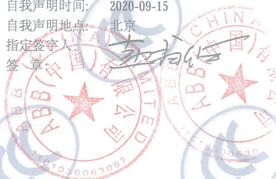
ABB Oy Smart Power P.O.Box 622 FI-65101 VAASA FINLAND

注: 有关本声明信息真伪可登录全国认证认可信息公共服务平台 (cx.cnca.cn) 或扫描右上角二维码查询。