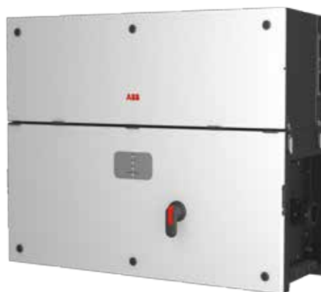
ABB String-Wechselrichter PVS-100/120-TL 100 bis 120 kW