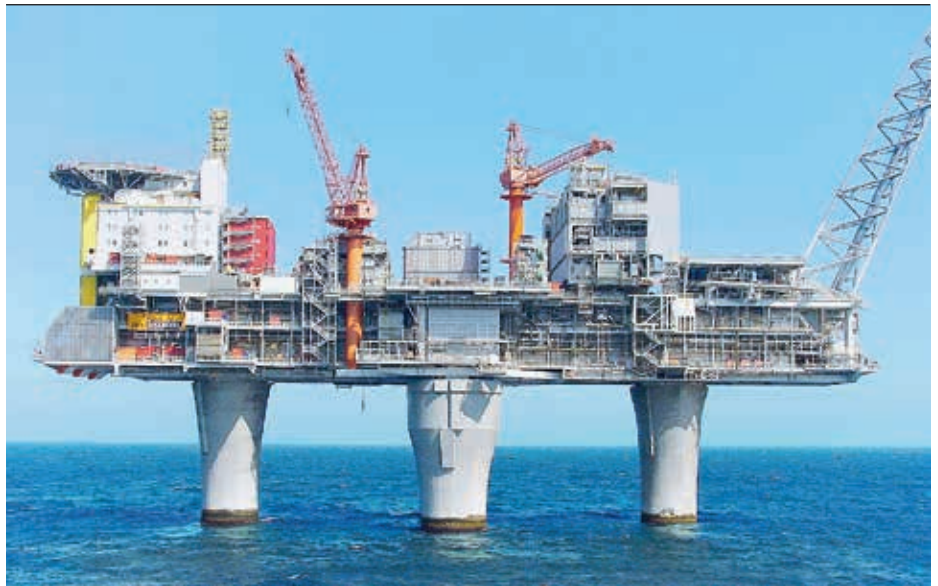
2 Die Plattform Troll A. Die HVDC-Light-Station ist der graue Kasten zwischen den Kranen.

topologien und Regelalgorithmen einschließlich Strategien zur Pulsweitenmodulation (PWM) ermöglicht.