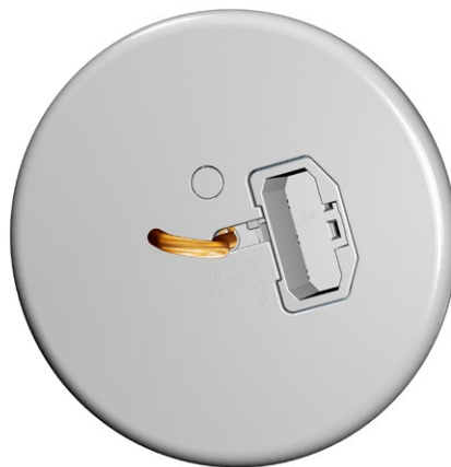
ABB Oy PL 16 (Porvoon Sisäkehä 2) 06101 PORVOO Vaihde 010 2211