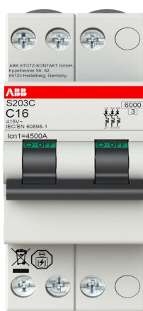
3P 2 moduļi