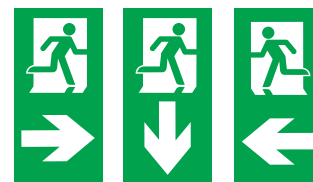
Étiquettes pour montage drapeau 661 011