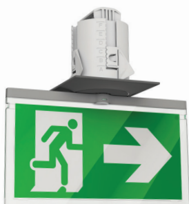
01 BrioSpot 60L A