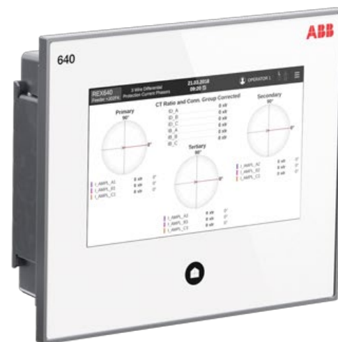
ABB OY DISTRIBUTION SOLUTIONS