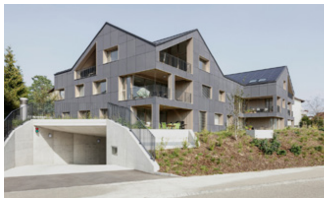
ABB Suisse SA Electrification Rue du Sablon 4 CH-1110 Morges Tél. +41 58 588 40 50

La domotique avec ABB-free@home® augmente l' efficacité énergétique dans les appartements. De plus, les occupants voient leur consommation d'énergie en temps réel et peuvent l'optimiser facilement.