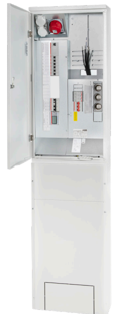
01 Näpsä SMART -EV ulkomittauskeskus 1T-MK50J-O-EVC

Näpsä SMART -EV-ulkomittauskeskus sisältää kaikki latausaseman vaatimat komponentit valmiiseen asennukseen. Ilman latausasemaa keskus toimii tavallisena ulkomittauskeskuksena. Lataustehojen ylä ja ala-rajat säädät kätevästi mobiiliapplikaatiolla.