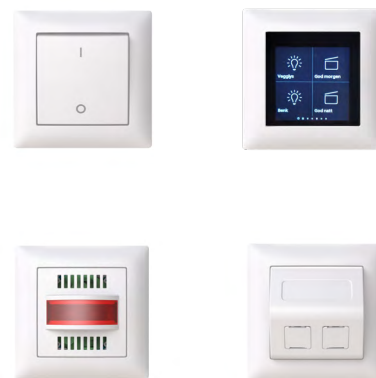
ABB Electrification Norway AS Snarøyveien 30 1360 Fornebu Kundeservice: automasjonsprodukter@no.abb.com

Mer enn bare brytere og stikkontakter - SAGA™ kan kombineres med en rekke elektroniske innsatser som enkelt kan integreres i ABB smarthus systemer som ABB i-bus® KNX og ABB-free@home®.