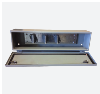
Boîtiers de répartition et caniveaux