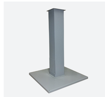
Piédestaux et bases