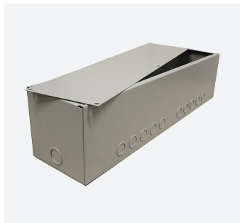
Câblage et passage