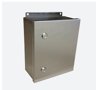
Boîtiers et armoires