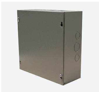
Boîtiers et coffrets