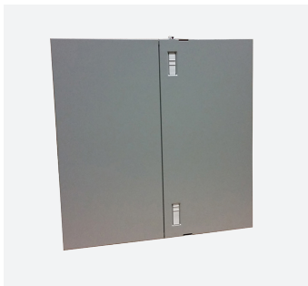
Armoires pour compteurs/télécom