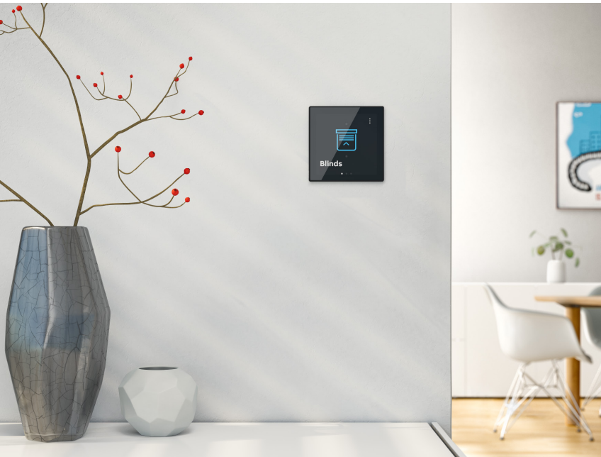
ABB-free@home ja ABB i-bus KNX -järjestelmiin

Pieni ja tyylikäs ABB RoomTouch 4” -kosketusnäyttö ABB-free@home ja KNX-automaatiojärjestelmiin. Käyttäjätasavallinen muotoilu intuitiivisella grafiikalla tekee laitteesta hyvin helppokäyttöisen, ja sen avulla voit ohjata päivittäisiä rutiineja aina valaistuksesta, kaihtimista, tilanteista ja aikaohjelmista huoneen lämpötilaan asti.