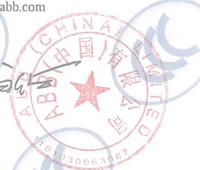
ABB Oy Smart Power P.O.Box 622 FI-65101 VAASA FINLAND

注: 有关本声明信息真伪可登录全国认证认可信息公共服务平台 (cx.cnca.cn) 或扫描右上角二维码查询。