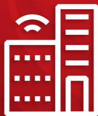
ABB Ability™ Escribir el futuro digital requiere habilidad.

Soluciones, servicios y productos digitales conectados. Reducción del consumo energético y optimización de costes de mantenimiento.