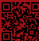
ABB Connect Todo ABB en tus manos.

Escanea el código QR para más información: