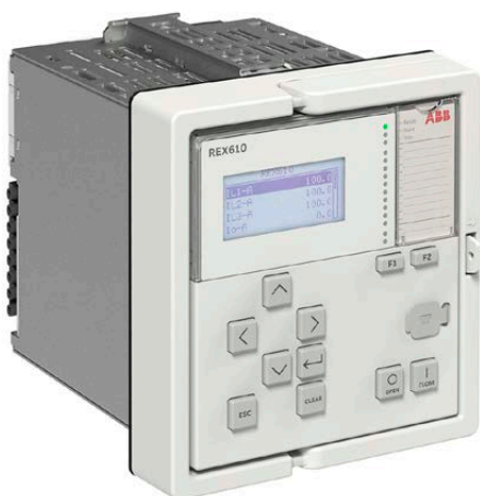
01 Relais de protection et de contrôle-commande REX610

Protection tout-en-un pour toutes les applications de distribution électrique de base