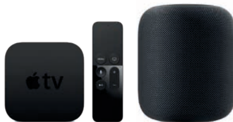
— Apple TV Apple HomePod