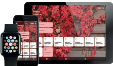
— Apple HomeKit

— Usa HomePod per controllare le funzioni attraverso la tua connessione Apple HomeKit