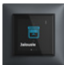
SIDUS® touch Display in Anthrazit