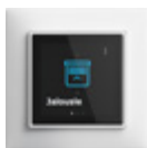
SIDUS® touch Display in Weiss matt