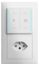
Kombination mit SIDUS® touch und Steckdose in Weiss matt

Mit den ABB SIDUS® touch Anzeige- und Bediengeräten bieten wir modernste Einsätze für das langjährig bewährte Schalter- und Steckdosenprogramm SIDUS®. Mit seiner innovativen Wischfunktion, animierter Lichtführung und den anpassbaren Anzeige- und Bedienelementen verleiht SIDUS® touch jedem Raum einen «Touch der Perfektion».