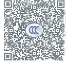
ABB Switzerland Ltd, Low Voltage Products (生产者) 及 ABB (中国) 有限公司(生产者授权代表) 确认知晓《强制性产品认证自我声明实施规则》以及相关产品强制性认证实施规则的要求, 对本声明承担全部法律责任。

ABB Switzerland Ltd, Low Voltage Products (生产者) 及 ABB (中国) 有限公司(生产者授权代表) 声明以下产品已按照《强制性产品认证自我声明实施规则》以及相关产品强制性认证实施规则的要求进行检测, 符合相关标准要求; 自本声明签署之日起, 生产和销售的产品持续符合以下标准与实施规则的要求; 保存本声明涉及的技术文档至少10年; 正确使用强制性产品认证标志; 如产品或其符合性信息发生变更, 将及时更新技术文档并报送产品变更信息。