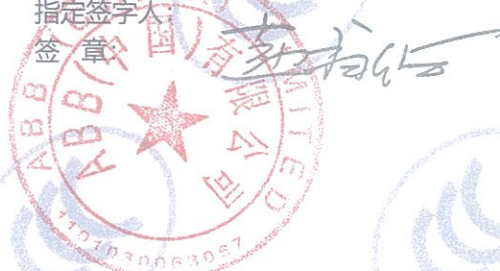
ABB Switzerland Ltd Low Voltage Products Fulachstrasse 150 CH-8201 Schaffhausen

授权代表信息 名称: ABB (中国) 有限公司 地址: 北京市市辖区朝阳区酒仙桥路10号恒通厂厦 联系人: 钱钰 电话: 18621366988 电子邮箱: yu.qian@cn.abb.com 自我声明时间: 2020-09-23 自我声明地点: 北京 指定签字人: 签章: