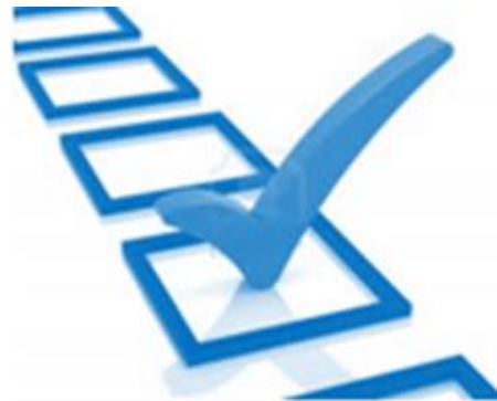
ABB completa el portafolio con soportes Web basados en conferencias y formaciones en línea que aportan una gran calidad a los programas de formación, sin necesidad de desplazamientos. ABB apuesta por este tipo de formaciones ya que es una forma fácil y económica para los clientes de aprender sobre los productos de ABB. Con esta infraestructura, la formación se puede llevar a cabo en cualquier sitio donde haya conexión a internet. Los alumnos pueden asistir a las lecciones desde su puesto de trabajo y evaluar su mejora de los conocimientos paso a paso.

Las formaciones presenciales permiten un aprendizaje en un ambiente dedicado y seguro, lejos del ruido y las presiones del puesto de trabajo. Son impartidas por un profesor con experiencia y los participantes aprenden los unos de los otros interactuando en grupo, compartiendo situaciones y experiencias reales de la planta. También hay la posibilidad de realizar prácticas, ya sea en la clase o en el puesto de trabajo, para reforzar el aprendizaje.