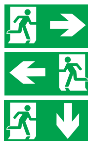
Étiquettes pour montage mural et plafond BrioSpot R : 100 701K