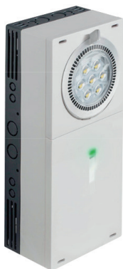
01 ALTILED ET 48...230/1000L A