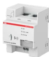
01 Building Edge